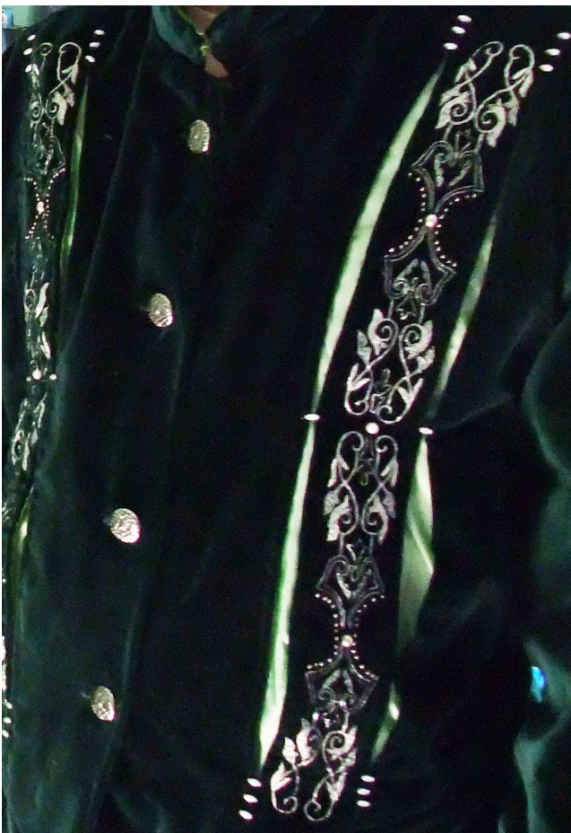
Stickerei grünes Wams

Malen Sie das Stickmuster mit einem Pastellstift auf Transparentpapier nach. Legen Sie die bemalte Seite nach unten auf die Rückseite des Baumwollsamtes und übertragen Sie das Muster durch Darüberstreichen mit dem Finger. Sticken Sie zuerst die Konturen nach, sticken Sie dann das Muster vollständig aus.