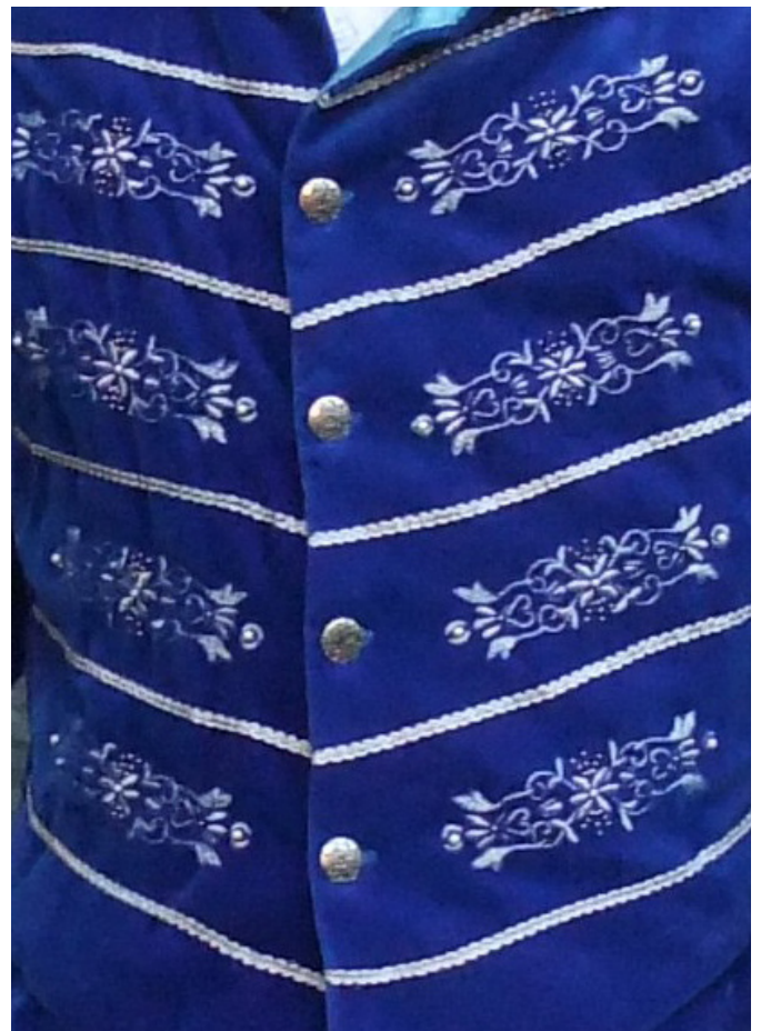
Stickerei blaues Wams